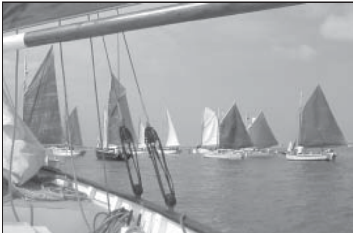
La flottille à l'ancre prête pour le départ.

Djinn et La Confiance se livrent une lutte courtoise mais acharnée, La Confiance semble prendre le meilleur sur le dernier bord de portant en tanguant son foc mais Djinn reprend l'avantage sur la ligne grâce à une meilleure vitesse sur le dernier bord de près. Il fallait déjà regagner le port où le repas des équipages préparé par Yves et son équipe nous attendait.