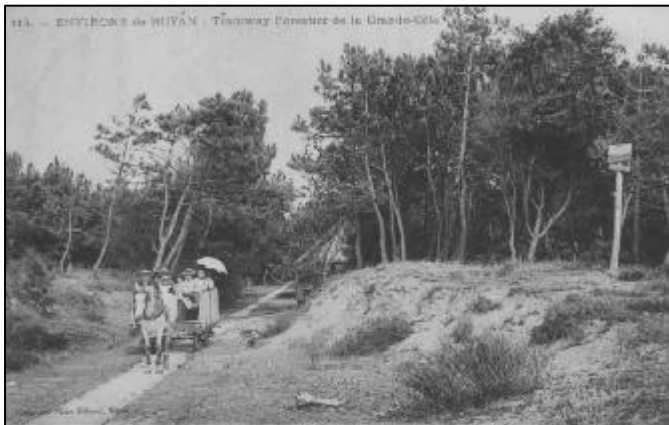
-Environs de Royan - Tramway forestier de la Grande-Côte.