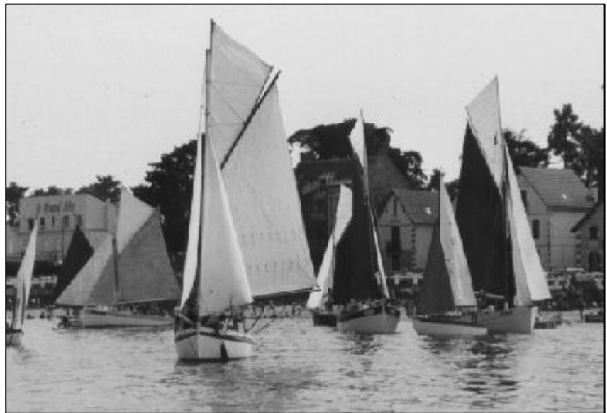
Le Départ devant la Petit-Plage.

Vers quinze heures, la flottille grossissait encore de voiles venues de l'horizon qui ralliaient au gré de la brise la Petite-Plage de Saint-Trojan où une foule nombreuse s'était massée. C'est finalement une trentaine de bateaux de tradition qui s'élançait sur la ligne aux deux