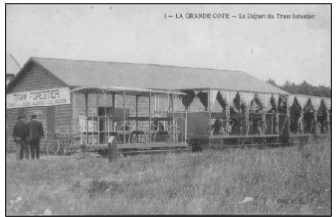
- La Grande Côte - Le Départ du Tramway forestier.