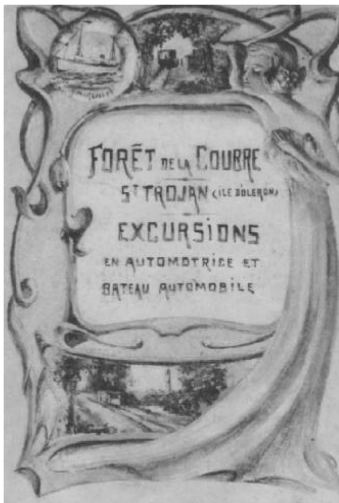
Couverture du programme des excursions de 1911.

C'était une autre époque et le charme de ces voyages fait aujourd'hui définitivement partie du passé.