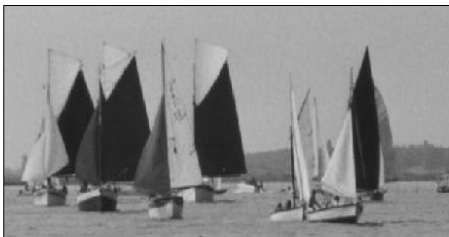
La meute des concurrents.

Après la seconde marque et alors que les embarcations piquent maintenant vers la plage, le classement définitif se confirme : Pépé Charlot II devra s'incliner cette année devant Paol comme il l'avait fait en 1996 après quatre victoires consécutives.