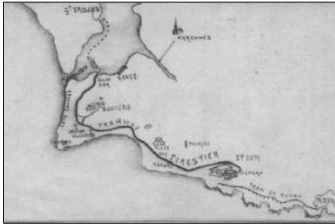
Plan de l'excursion en automotrice et bateau automobile de Royan à St-Trojan par la Forêt de la Coubre.