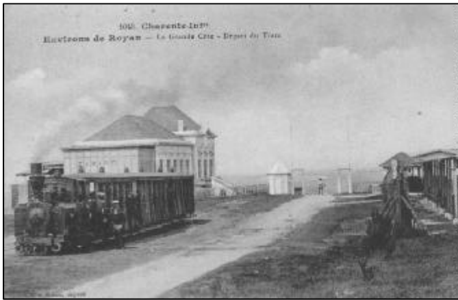
-Environs de Royan - La Grande Côte - Départ du Tram.