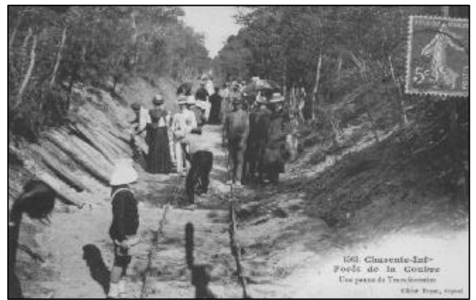
-Forêt de la Coubre - Une panne du Tram forestier.