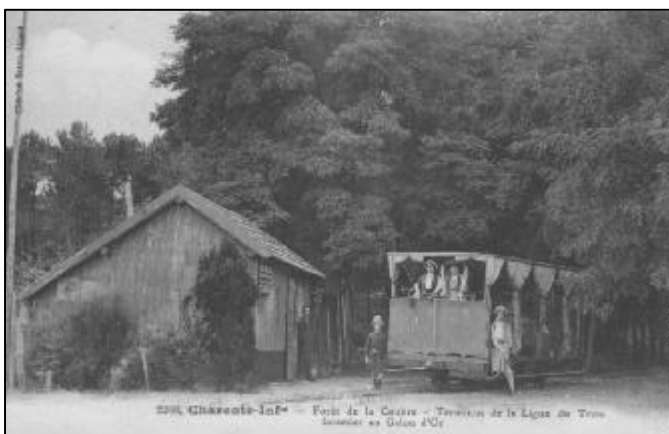
-Forêt de la Coubre - Terminus de la ligne du Tram forestier au Galon d'Or.