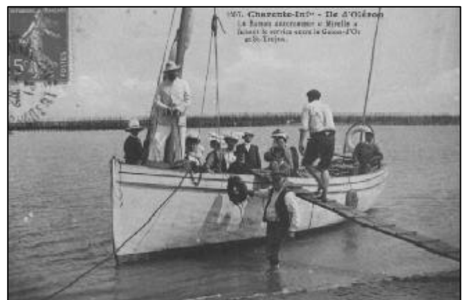
-Le Bateau automoteur "Mireille"- faisant le service entre le Galon-d'Or et St-Trojan.